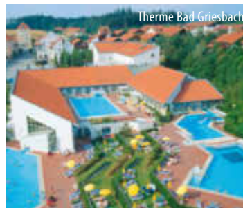
Thermo Bad Griesbach